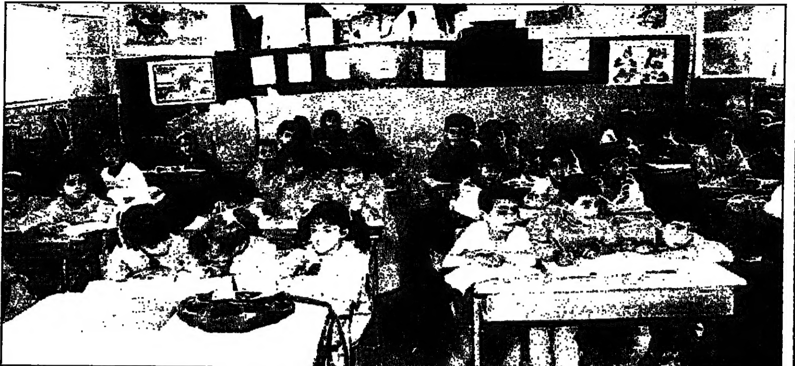
غرفة صف جاهزة للصنع في مدرسة لاورتوزيا في مخيم «جورج» - اليرموك